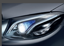
Multibeam LED (P35)