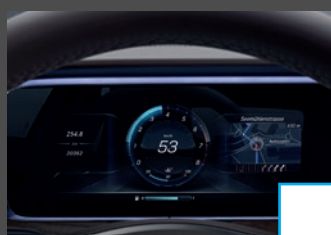
Widescreen cockpit (464) € 1.029