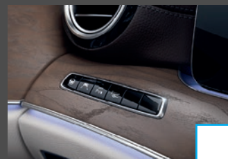
Rijassistentiepakket Plus (P20) € 2.904